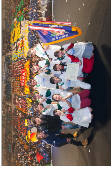
▼ 第38回 グランプリ校賞 受賞校 柴島高校(軽音楽部)と 府民共済SUPERアリーナ会場応援団 記念撮影